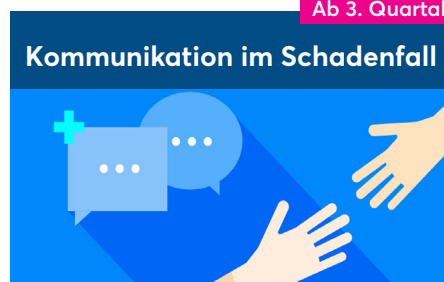
Kommunikation im Schadenfall